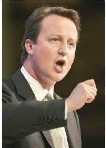
David Cameron, stilaan het idool van rechts Vlaanderen

Tweede vraag: over wat voor jobs gaat het? Het zal wellicht niet over 'kwalitatieve' jobs van hoog niveau gaan. Men spreekt wel eens van gemeenschapsdienst, maar een precieze omschrijving is er niet. Gaat het dan om allerlei klussen uitvoeren? Zoals de Britse premier Cameron recent voorstelde: monumenten gaan opkuisen? Zijn er dan zoveel monumenten dat men alle uitkeringsgerechtigde werklozen daar permanent mee kan bezig houden? Aangezien meer en meer van het gemeenschappelijke "publieke domein" wordt geprivatiseerd en geliberaliseerd, is er niet veel ruimte meer om al die werklozen "gemeenschapsdienst" te laten doen. Velen daarvan zullen dus in de privé geplaatst moeten worden. Waarbij zich natuurlijk de eerste vraag weer opdringt: aan welke loons- en arbeidsvoorwaarden?