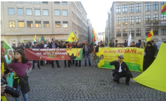
Manifestatie voor Kobanê in Brussel, op de dag van de Turkse verkiezingen.

Erdogan zal als onderaannemer van de Islamitische Staat in Syrië en Al Sham (ISIS) ook ontvangen worden in de hoogste cenakels van het Belgische en Europese politieke circus. Men moet zijn vrienden (er)kennen! De V-SB protesteert eens te meer tegen deze schandelijke daad van de Belgische en Europese regimes.