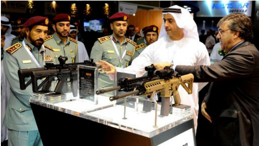
Vertegenwoordigers uit Dubai, op de conferentie in 2013.

Vredesactivisten protesteerden tegen deze conferentie. Pegida en soortgelijken waren daarentegen afwezig. Wellicht zijn moslims nog best OK, als ze komen om onze wapens te kopen.