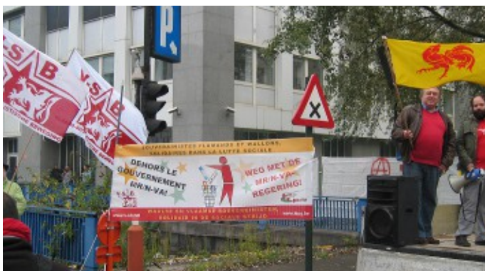
V-SB samen met Waalse soevereinisten van Pôle de Gauche

Verwarming en verlichting zijn basisbehoeften die niemand tekort zou mogen komen. Een regering die dit recht op het spel zet en net zou moeten toezien op het welzijn van de burgers, is het niet waardig om een regering genoemd te worden. De V-SB hoopt dan ook dat de regering deze volstrekt irreal en mensenwaardige belasting snel zal intrekken.