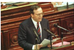
Wilfried Martens, de Vlaamse "Reagan", grondlegger van het neoliberale beleid in de Belgische staat.