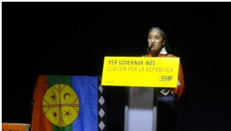
Vertegenwoordigster van de Mapuche-vrouwenbeweging

De gezamenlijke aanwezigheid van de V-SB en Wallonie Insoumise werd overigens zeer geapprecieerd door het internationale gezelschap, ons optreden opende bij heel wat aanwezigen de ogen over de Belgische staat en ons antwoord daarop, als Vlaamse en Waalse solidaire soevereinisten.