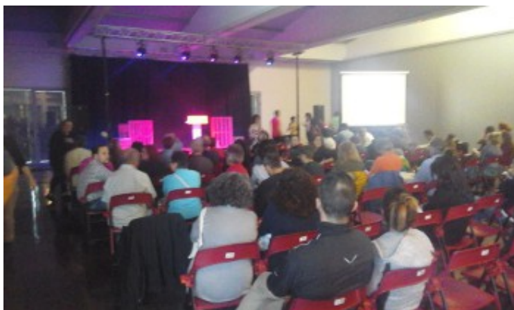
Ontmoeting tussen de internationale delegatie en lokale militanten in Sabadell