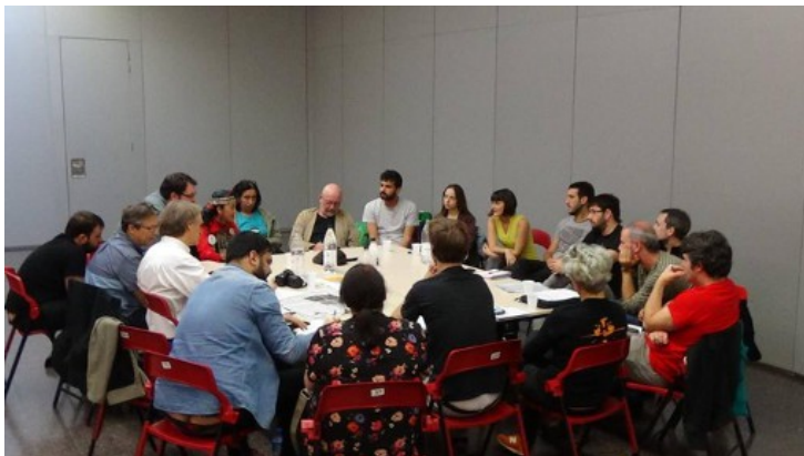
Bijeenkomst van de Internationale Delegaties in Sabadell

bewegingen over heel de wereld, net zoals de Baskische linkse bewegingen dat doen. Aan de vooravond van het referendum werd een eerste internationalistische bijeenkomst georganiseerd rond dat referendum met vertegenwoordigingen uit o.a. Baskenland, Galicië, Castilië, Ierland, Schotland, Engeland, Koerdistan, Vlaanderen (V-SB) en Quebec, en enkele weken later volgde een tweede waar naast deze ook nog vertegenwoordigers uit Zweden, Duitsland, Griekenland, de Mapuche, Italië, het Rif (Berbers), Occitanië en de Waalse kameraden van Wallonie Insoumise bij waren. Bij deze tweede bijeenkomst lag de focus vooral op de vorming van een internationaal netwerk voor steun aan de kort daarvoor uitgeroepen republiek, al werden ook een aantal andere internationale kwesties besproken.