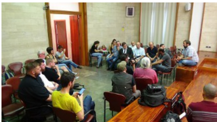
Internationale delegatie op bezoek bij gemeentebestuur van Sabadell

Het is echter pas sinds enige jaren dat CUP actief is op een hoger bestuurlijk niveau, met name dan in het parlement van de Autonome Gemeenschap Catalonië. Daar haalde ze in 2012 drie verkozenen en in 2015 tien. De opmerkelijke score in 2015 was een rechtstreeks gevolg van het "plebisciet" het jaar daarvoor, door de toenmalige regering van Artur Mas georganiseerd, waar CUP ook een rol in speelde. Met deze tien verkozenen was CUP "kingmaker" in het op de been helpen van de nieuwe regering-Puigdemont, wiens kartel "Junts pel Sí" enkele zetels te weinig had voor een absolute meerderheid. De steun van CUP aan de grotendeels liberale regering was zeer omstreden, ook in eigen rangen. Aanvankelijk weigerde CUP dan ook bijvoorbeeld de begroting goed te keuren. Dat deed ze uiteindelijk toch, op voorwaarde dat er een (nieuw en dit keer bindend) referendum zou georganiseerd worden, dat uiteindelijk op 1 oktober plaatsvond. De (tijdelijke) steun aan een liberale regering was zeker geen enthousiaste keuze geweest en zorgde intern voor heel wat spanningen. Anderzijds: zonder de steun van CUP was er geen referendum geweest, en dus ook niet de enorme mobilisatie die door dat referendum op gang kwam.