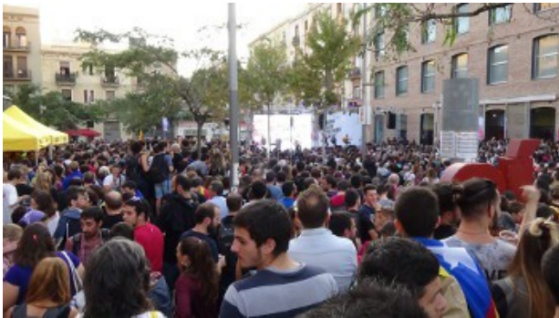
Campagnemeeting in Poble Nou, Barcelona

Vanuit de Vlaams-Socialistische Beweging onderhouden we goede contacten met de Catalaanse partij Candidatura d'Unitat Popular (Kandidatuur voor de Volkseenheid), de radicaal linkse en onafhankelijkheidsgezinde partij die een opmerkelijke rol heeft gespeeld in de campagne rond het referendum in Catalonië (en lang daarvoor al een rol speelde). Door de radicaal basisdemocratische aard van deze partij, gecombineerd met een antikapitalistisch én soevereinistisch karakter, is die rol altijd zeer omstreden geweest. Deelname aan de gevestigde machtsstructuren druist in tegen het wezenlijke karakter van de partij, maar de omstandigheden vereisten wel enige betrokkenheid, vooral de voorbije twee jaar. In oktober en november was de V-SB aanwezig op verschillende internationale bijeenkomsten georganiseerd door CUP, alsook vertegenwoordigd als internationaal waarnemer bij het referendum van 1 oktober, op uitnodiging van CUP.